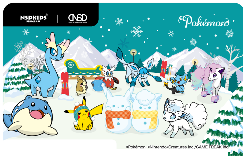
リフト IC カード（デザインはポケモン）

NSD キッズプログラムのシーズン券には、ポケモンがデザインされています。「雪山へ行くときはいつもポケモンと一緒に」をテーマに雪山デビューを応援しています。ポケモンデザインのリフト IC チケットはお子様の顔写真の入ったシーズン券のため、IC チケット入手後は、リフト券購入の列に並ぶ必要もなく、そのままリフトへダイレクト IN できます。