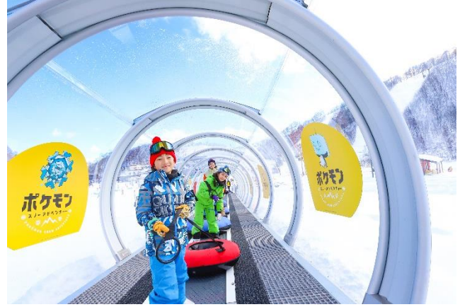
ポケモンスノーアドベンチャー（鹿島槍スキー場 ファミリーパーク）