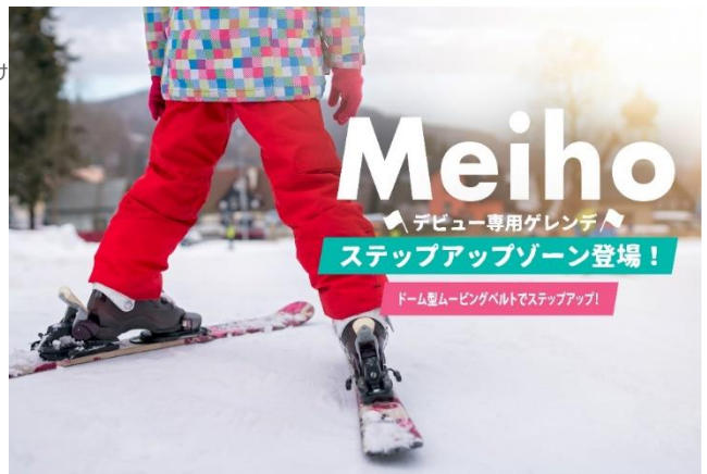
ステップアップゾーン（めいほうスキー場）