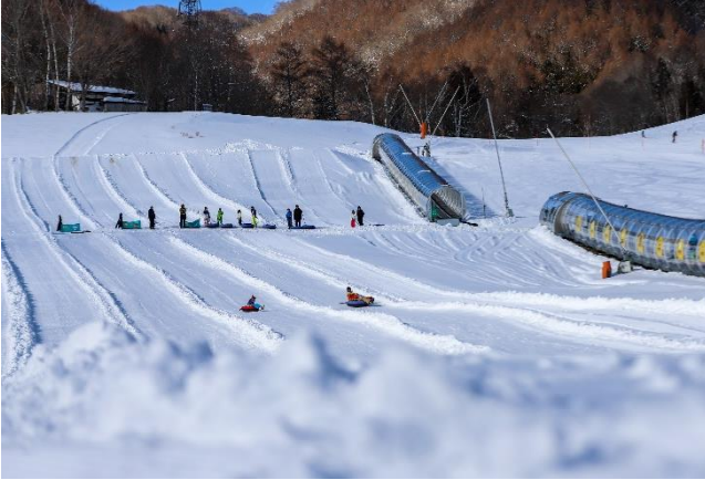
ポケモンスノーアドベンチャー（鹿島槍スキー場 ファミリーパーク）

NSD グループスキーリゾートでは、ノンスキーヤーでも雪遊びを楽しむことのできる施設設置にも取り組んでいます。 ポケモンスノーアドベンチャー