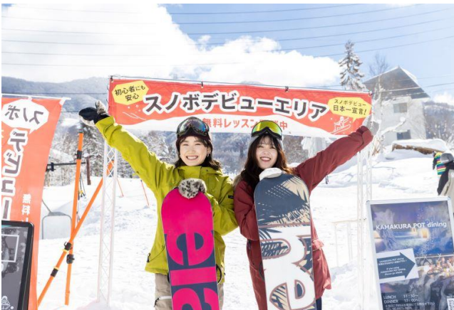
スノボデビューエリア（竜王スキーパーク）