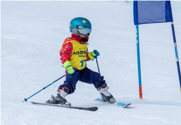
第二回 NSD キッズプログラムスキー・スノーボードキッズ大会

お子様が貴重な体験をすることでより上達を促し、大人になってからもウィンタースポーツに触れ合う環境を提供していきます。